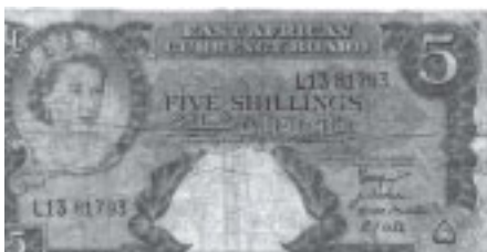
Picture of an old 5 sh note and 1 sh, 50, 10, 5 cent old coins