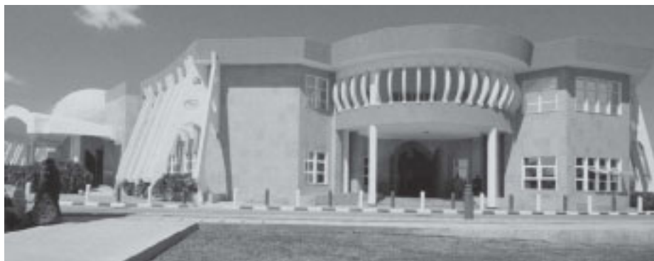
Parlamentsbyggnad i huvudstaden Dodoma, men inga regeringsbyggnader än.

Tanzania kommer att få sitt allra första smältverk för koppar efter en överenskommelse mellan Kigomas regionstyrelse