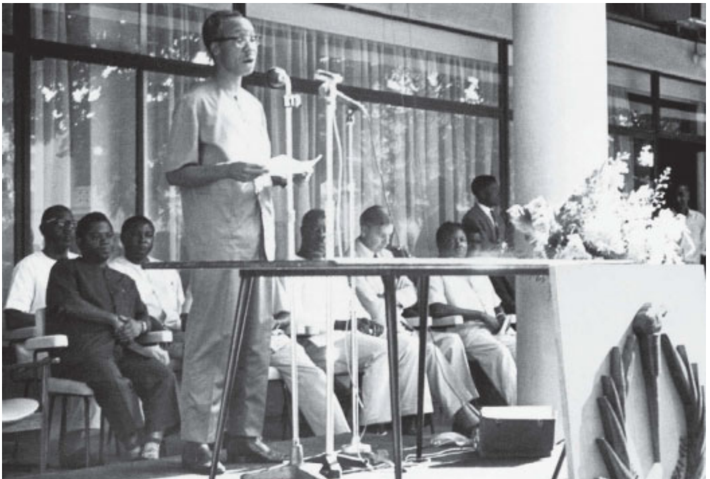
Official opening of Bank of Tanzania by H.E. President Julius Nyerere. In dark dress 2nd Vice President Rashidi Kawawa. The first office of the bank was situated at the junction of Samora Avenue and Ohio Street. This office is now used by Kenya Commercial Bank's Dar branch.