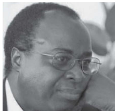
Chefen för Bank of TZ Benno Ndulu.