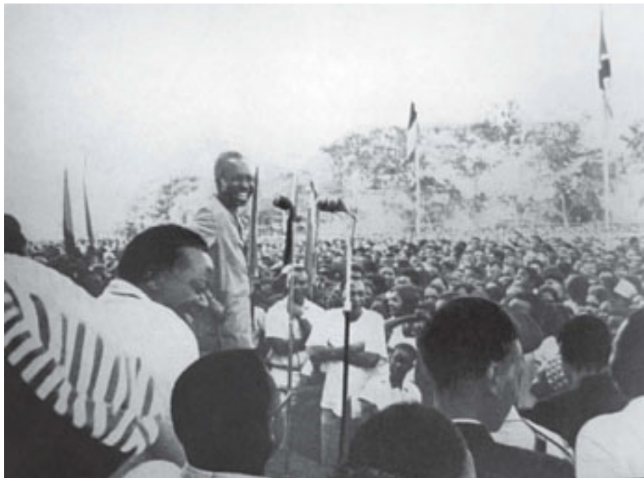
President Nyerere addressing the crowds at Mnazi Mmoja, Dar es Salaam, introducing the Arusha Declaration on the 5th February, 1967. Pictures from Nyerere's book: Freedom and Socialism—Uhuru na Umoja, 1968.

The Declaration also quoted the TANU creed which stated "that in order to ensure economic justice the state must have effective control over the principal means of production and that it is the responsibility of the state to intervene actively in the economic life of the nation so as to ensure the wellbeing of all citizens". The implementation of this part of the Declaration was sharp and immediate and started the day after the announcement of the Declaration. The government took control of "the commanding heights of the economy" by nationalizing industrial companies, trade corporations, bank-