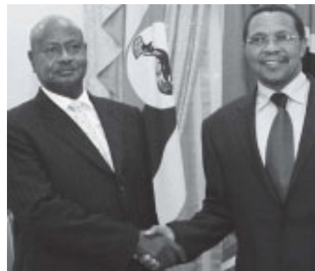
Museveni och Kikwete skakar hand på beslut om ny järnväg Tanga – Musoma.

De i Dar som bor utanför city, särskilt i Kimara, Ubungu, Manzese och Magomeni gläds nu efter regeringens beslut att förse