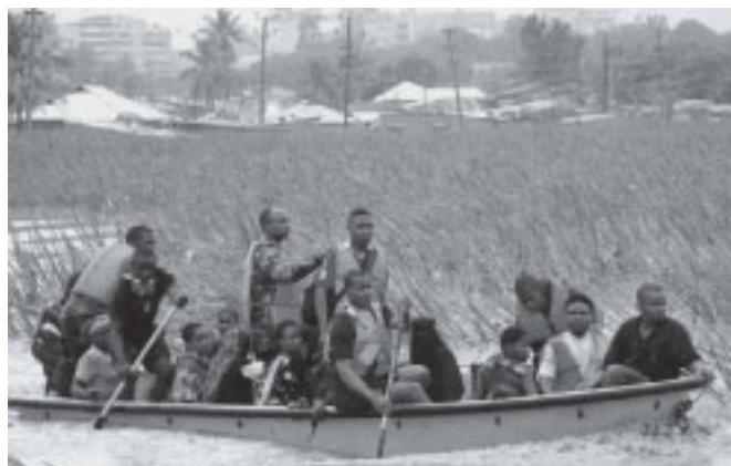
Många innevånare i Dar es Salaam måste evakueras per båt sedan delar av staden helt översvämmats.

Katastrofer, hungersnöd, förstörelse, vansinniga trafikolyckor och politisk teater var bara några av 2011 års huvudvärkar. I ett land med benägenhet för både naturkatastrofer och katastrofer orsakade av människan var MV Spice Islanders kapsejsning i september den svartaste händelsen. Dödsskjutningen av fyra oppositionsdemonstranter i Arusha, bombexplosionerna i Gongo la Mboto och översvämningarna i december med ett hemlöst nyår i misär för många krönte tragedierna. 2011 innebar även en beräknad förlust av 7 000 arbetstillfällen p.g.a. brist på elkraft. Inflationen blev förra månaden 19,2 % från att ha varit under 5 %. Givarkollektivet har inte heller varit nådiga mot staten utan hållit hårt i börsen p.g.a. långsamma reformer och kriget mot korruptionen. ( The Citizen )