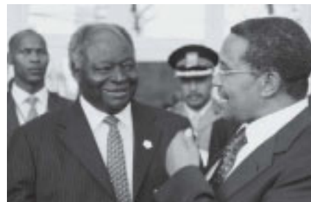
Presidenterna Mwai Kibaki och Kikwete: TZ stöder Kenyas insatser mot Al-Shabab.