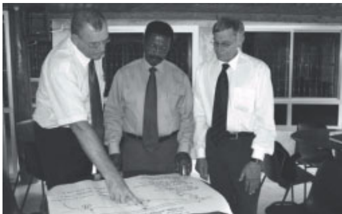
Ingenjörer från Gotland diskuterar ritningar med direktör Swai.

dygnet och vid påsläpp läcker ut genom öppna kranar. Många gånger finns inget vatten att distribuera eftersom överföringsledningarna ofta stängs av.