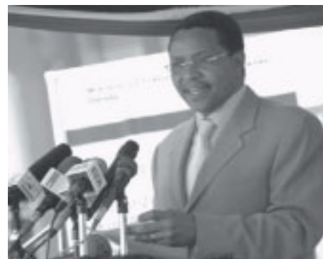
President Kikwete till diplomater: Blanda er inte i det kommande valet!

Pembaborna känner sig förbisedda. En grupp äldste på Pemba menar att Pembabor, trots handslaget mellan President Amani Karume och CUF-ledaren Seif Sharif Hamad ännu inte representeras i Zanzibars administration. Man vill därför att Pemba skall avskiljas från Zanzibar (Unguja). De har även skrivit till FN för att få gehör för sina krav. ( Mwananchi )