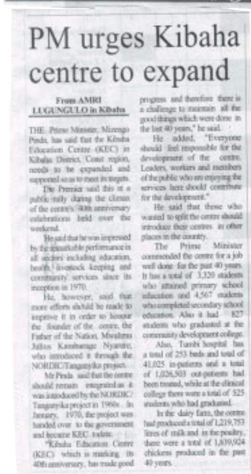
Ur Daily News, Dar es Salaam, måndag 18 januari 2010.