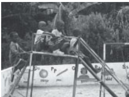
Lekeplass med læringsmiljø.