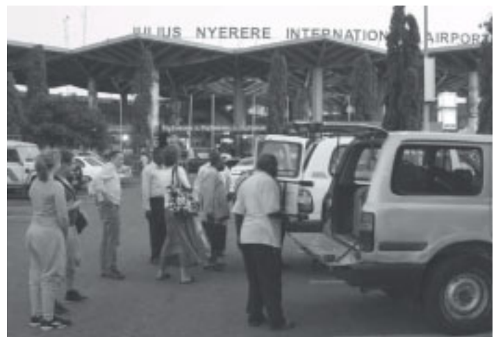
Här anländer vi till flygplatsen i Dar es Salaam.

I oktober 2009 kom våra tanzaniska vänner på besök och de var åtta studenter