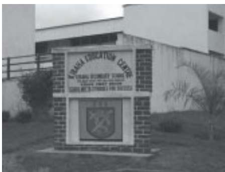
Fra inngangen til KEC ved hovedveien.