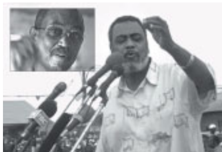
Zanzibars president Karume nu överens med CUF oppositionens Sharif Hamad.