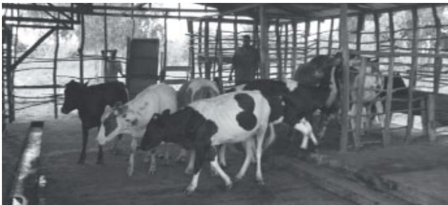
Besök på kogård på landsbygden.

och tre lärare. Vi hade förberett deras besök noggrant eftersom vi ville att de skulle känna sig lika välkomna som vi gjorde hos dem. Det blev tre fullspäckade veckor som innehöll skolverksamhet men också lite resor och turism för att de skulle få se olika delar av Sverige.