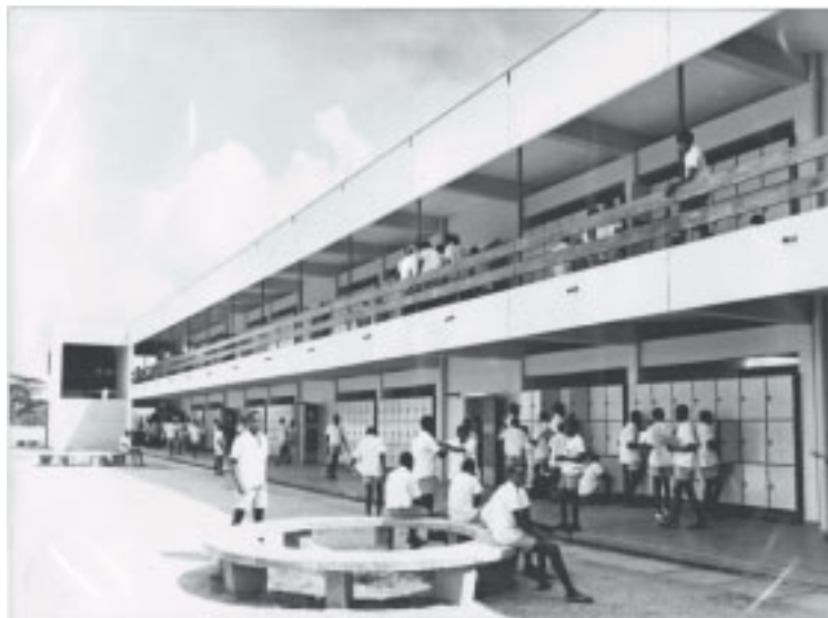
The central inside in Para 1 is centrally between 245 and 246 and in Para 7 about 77, which give 3 parallel streets in all Para. The students come from all over Tanzania.

Kibaha Education Centre is an exception in many ways. What once started as the Nordic Tanganyika Project has continued to develop and expand after the hand-over to Tanzania, despite harsh economic conditions and changes in organization and structure. How could this particular project survive when many other projects have not?