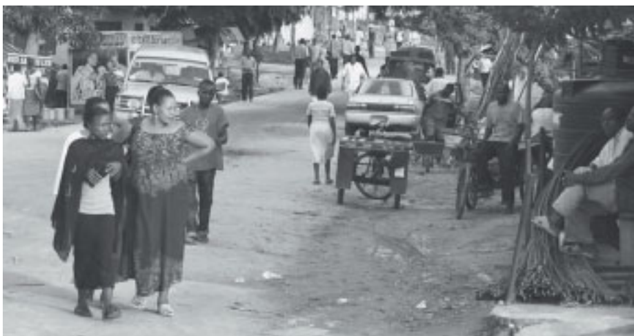
Gatubild från Kibaha.