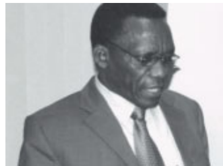
Premiärminister Pinda åkte till Bagamoyo för att se projekt – fanns bara på pappret!

El-bistånd. Zanzibars regering har vänt sig till givarländer för hjälp med generatorer för att klara av behovet av elkraft på öarna, en kris som varat sedan den 10 december i fjol. Regeringarna i Storbritannien, Norge och Sverige har lovat att bistå, men det var inte uttalat när generatorerna kunde levereras. ( Nipashe )