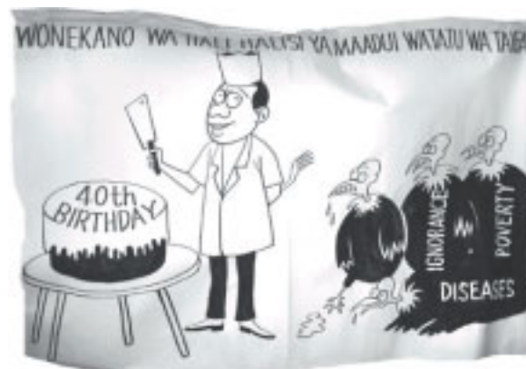
"Som verkligheten ser ut när det gäller nationens tre fiender"; den fjärde gamen som står först i kön till tårtan, står för "corruption".