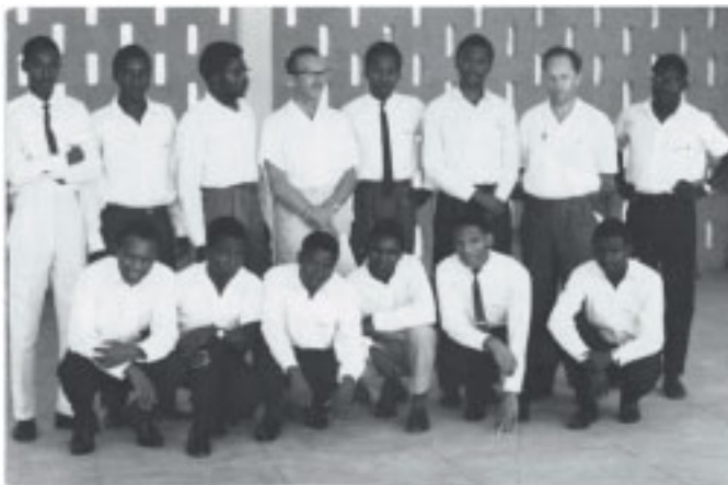
Elever på Kibaha Secondary School 1966 med rektor och studierektor.

The School has suffered from a missing tradition—we could not build a tradition within two years – and during the course of these two years the life at the school has marred by a conflicting intermixture of British colonial heritage, Scandinavian and local African (or should we call it Tanzanian) traditions. This does not make good reading but we are a growing body and out of this body we shall triumph in our way, enmeshed in an acceptable tradition and hopeful of a peaceful coexistence in our future society.