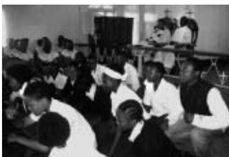
"Körerna dansar alltid till sången. Det verkar vara en enhet – rörelse/sång."

Kyrkokören sjunger en mer arrangerad sång med imitationer som startar i basstämman och sedan tas upp i de tre damstämorna. Precis som hos oss så kommer leendena när någon stämma "missar lite". Eftersom ingen synt styr, så förekommer här ritardando och tempoväxlingar, vilket gör det hela mycket mer levande.