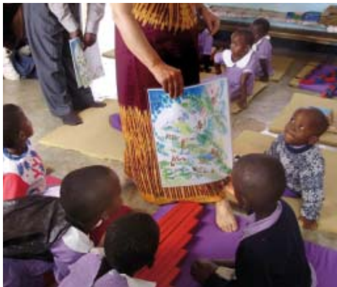
Praktik på en Montessoriförskola i Moshitrakten.