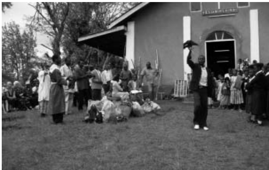
Efter gudstjänsten är det auktion på kollekt in natura.

Söndag. Gudstjänst i Foyeni. 600 m över Fukeni uppe bland bergen där grönskan är underbar. Bananer och majsodlingar och djungel. En väg som var obeskrivlig, både vacker och osannolik som väg sett. Men vi kom fram. Vi möttes av en