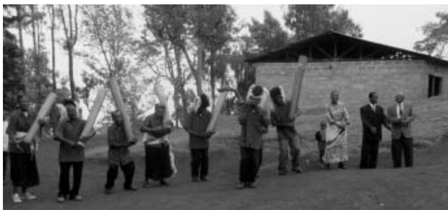
”Vi möttes av en ursprunglig chaggaorkester...”

Några intryck från gudstjänsten i Foyeni söndagen den 1 november 2009.