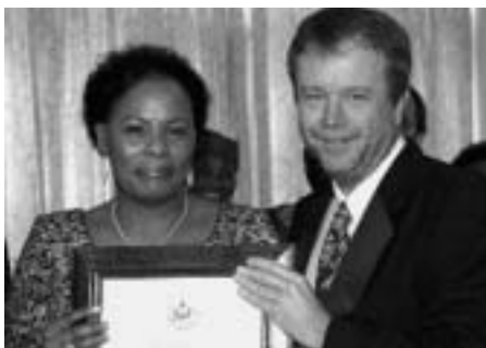
Kilango får pris av USAs ambassdör sid 12 - Habari 1/2010

2/4 Sex personer ställs inför rätta på grund av tågkrocken i Dodoma. ( Kulikoni och fyra andra )