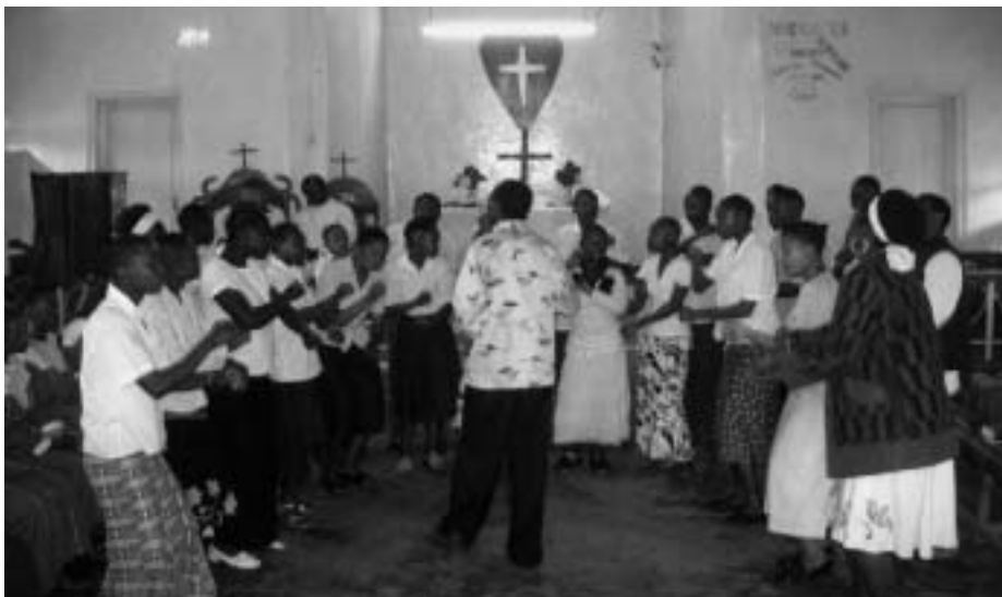
"Ungdomskörens ledare är en mycket musikalisk ung kille som väldigt noga ger ton till alla stämmor."

"Under denna fantastiska gudstjänst får jag många anledningar att reflektera över varför musiken i Tanzania och speciellt musiken i den lutherska kyrkan berör mig så mycket.