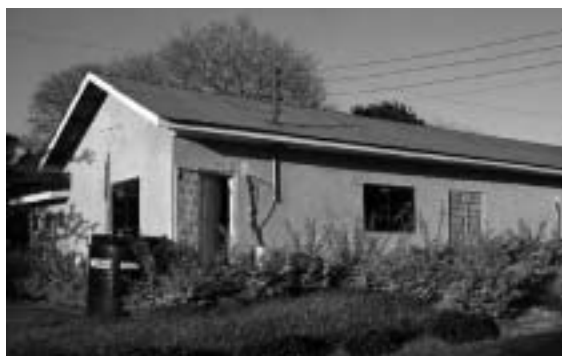
Studion bakom polisstationen i Tumbi nära Kibaha