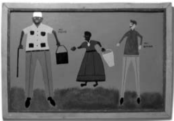
En mycket tidig Tingatingamålning som visar hur man skall vara kulturellt riktigt klädd med anledning av "Operation Vijana".