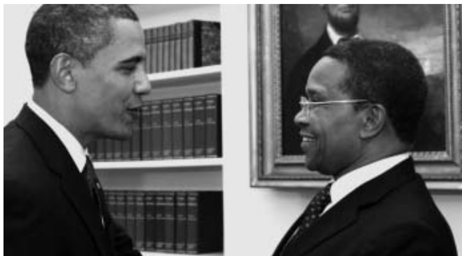
Obama hälsar på Kikwete – första afrikanske ledare att inbjudas till Vita Huset

52 500 ton föda har ätits upp av fåglar i Singida. ( Majira )