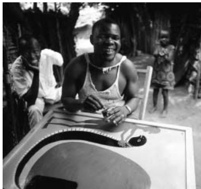
Prov på Tingatingas senare produktion.