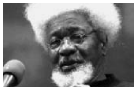
Nobelpristagare Soyinka kritisk mot ledare

Riksrevisorn slår larm om MP-vård. Parlamentsledamöterna har fått vård utomlands för ca 600 000 kr, utan att det godkänts av regeringen. ( Mtanzania )