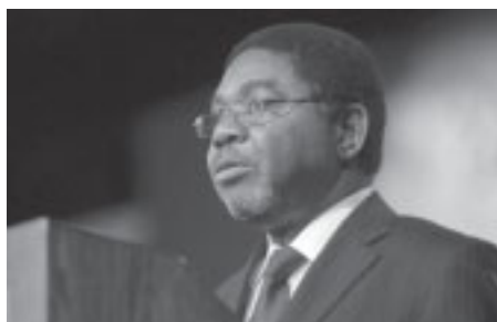
Vicepresident Ali Muhammed Shein tackar för Storbritanniens bistånd i samband med ambassadörsbyte